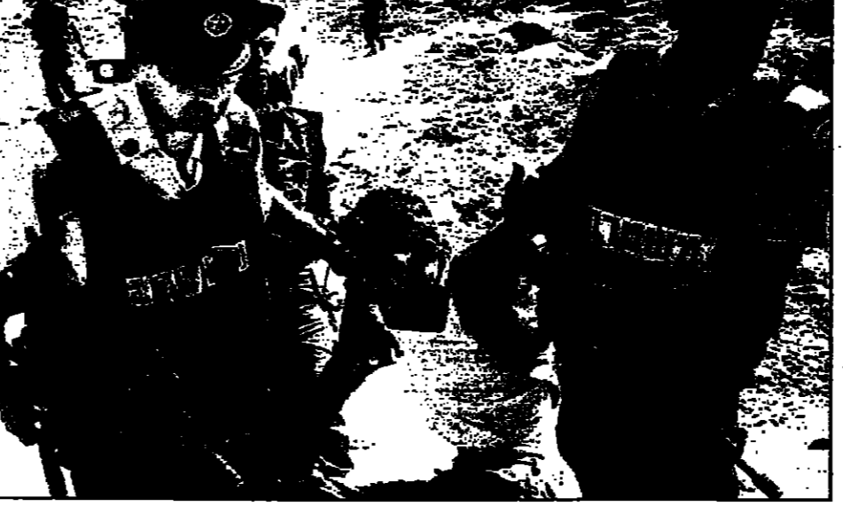
جرحى من الجيش الفلسطيني من راحة بعد يومين من الإصابة خلال شهرين في إحصاءه لصالح مستشفيات يهودية